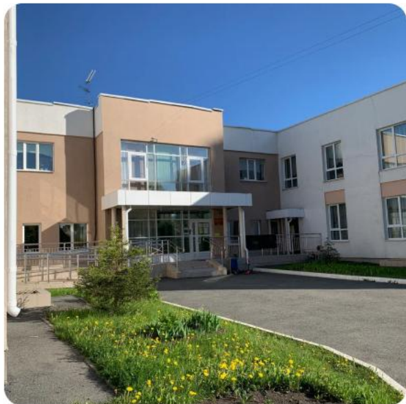
ДЕТСКИЙ САД № 47