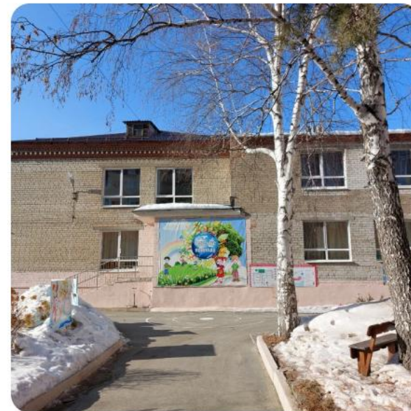
ДЕТСКИЙ САД № 386 "ЗНАЙКА"

Участие в разработке и реализации проекта