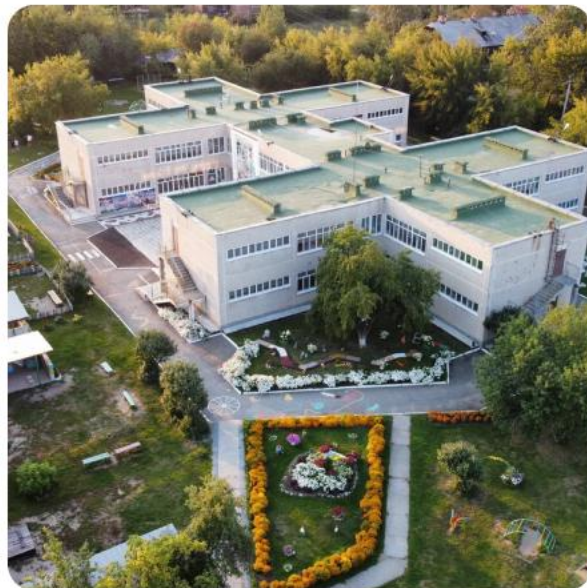
ДЕТСКИЙ САД № 578