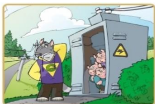
Не лезь на электроустановки и в трансформаторные будки

Опасно для жизни влезать на опоры линий электропередачи, проникать в трансформаторные подстанции или подвалы, где находятся электрические провода