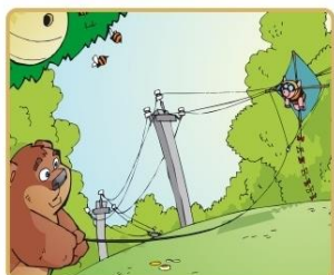
Не бросай ничего на провода и не играй вблизи

Никогда не заходите на территорию и в помещения электросетевых сооружений. Не открывайте двери ограждения электроустановок и не проникайте за ограждения и барьеры. Это может привести к печальным последствиям