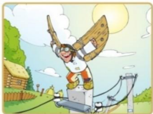
Не лезь на опоры и столбы

Чтобы не подвергать себя риску, запомните простые правила: